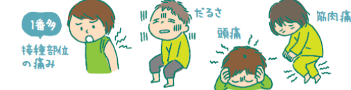
新型コロナワクチン(ファイザー社)接種後の副反応の出現頻度

副反応はワクチン接種が原因で起こる反応のことです。頻度は日本人が特に多いということはありません。1回目より2回目接種後により強く起こりやすいですが、十分な免疫をつけるには2回接種が望ましいとされています。また、このワクチンを接種しても人の遺伝子に影響が出ることはありません。